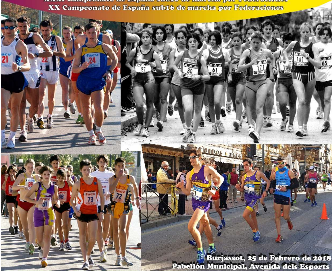
Burjassot, 25 de Febrero de 2018 Pabellón Municipal, Avenida dels Esports

XXIII Campeonato de España Master en Marcha en ruta (H:20km M-10km) XXXI Campeonato de España sub20 de marcha por Federaciones XX Campeonato de España sub16 de marcha por Federaciones