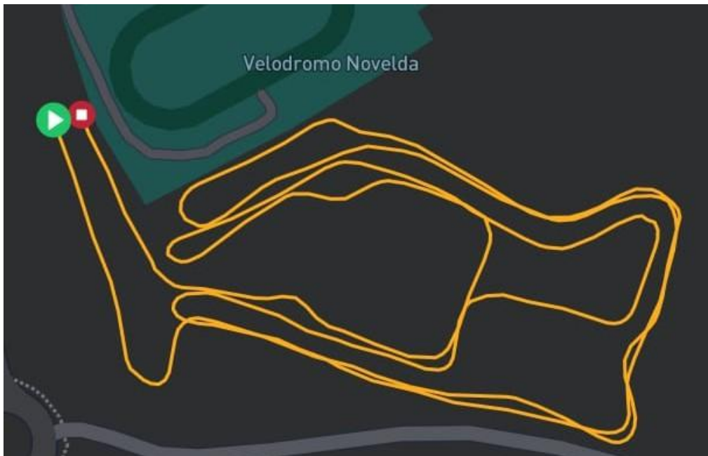
Circuito de 2000 m – B